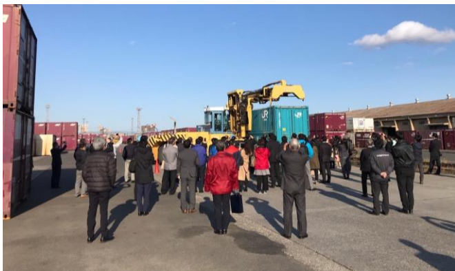
鉄道コンテナ見学会の様子(仙台貨物ターミナル駅)